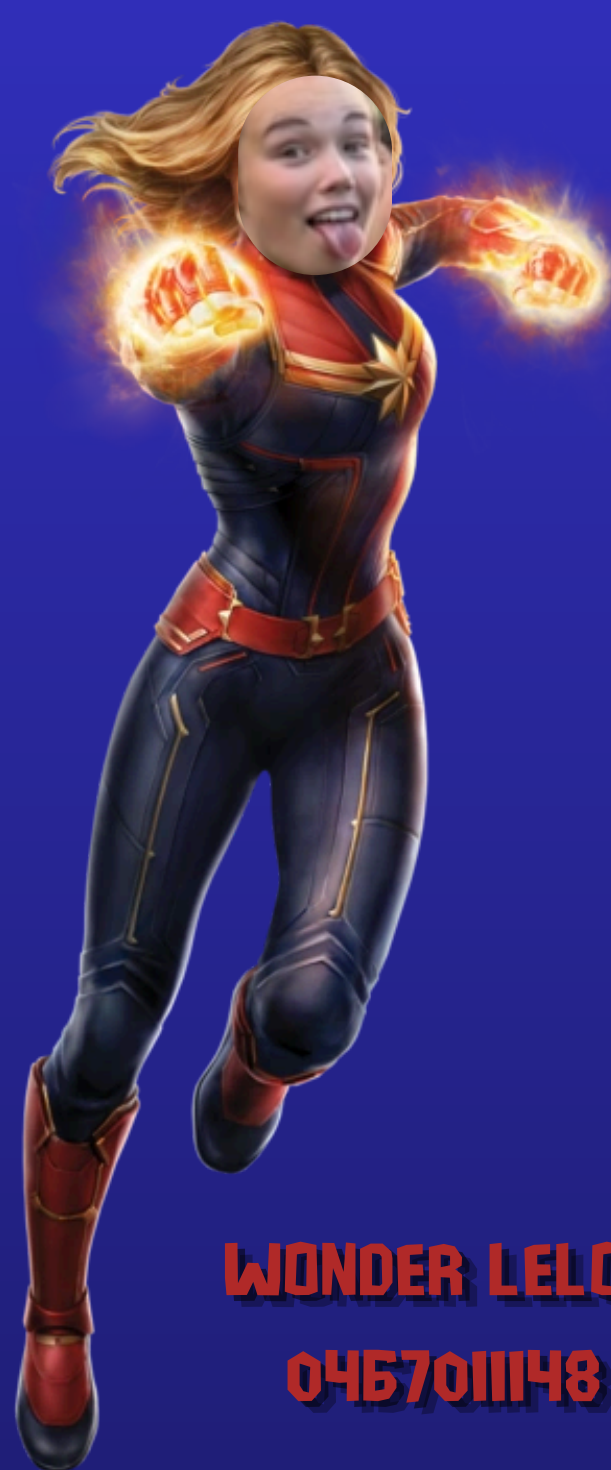
WONDER LELOU 0467011148