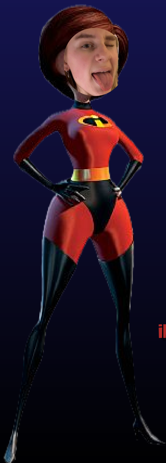
INCREDIBLE GORG 0473 40 27 32