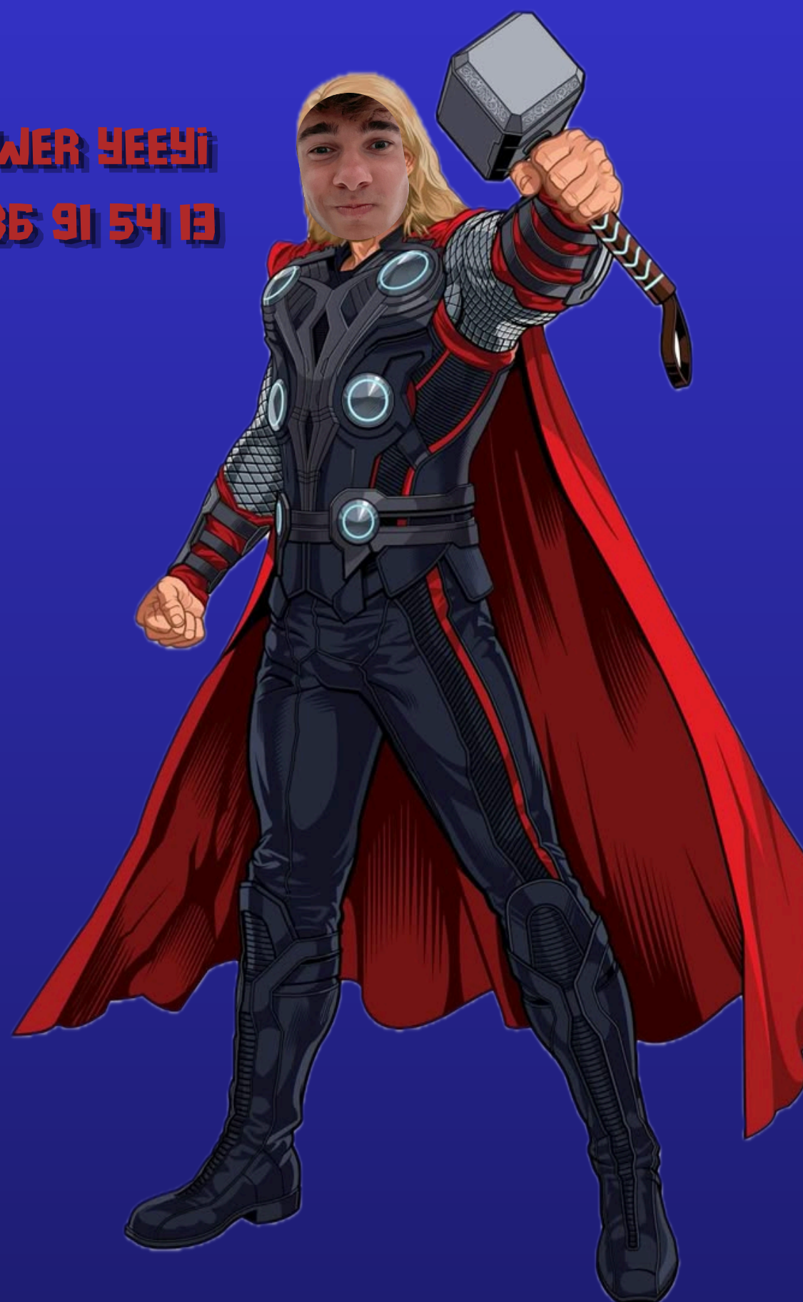
POWER HEEY! 0486 91 54 13