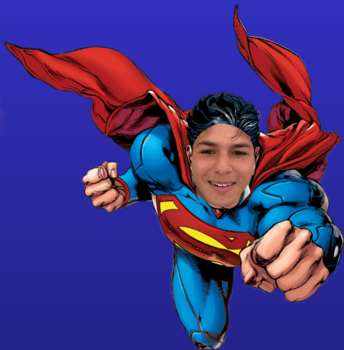
SUPER LOBO 0474 03 32 04